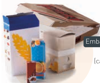
Emballages et briques en carton (carton à pizza...)