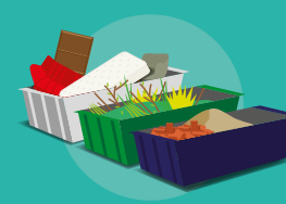
Benne en déchèterie