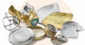
Tous les petits emballages en aluminium et acier (capsules...)