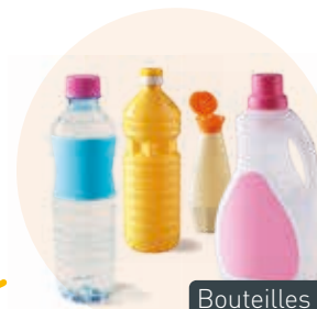
Bouteilles et flacons en plastique