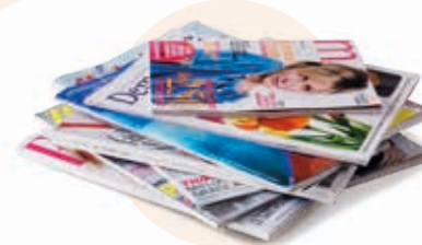
Tous les papiers (enveloppes, journaux, magazines, prospectus...)