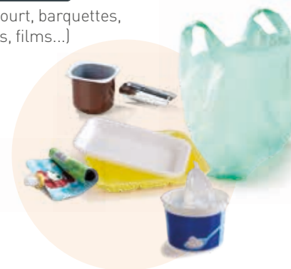
Tous les autres emballages en plastique (pots de yaourt, barquettes, sacs, films...)