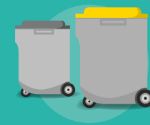
Bac de 240 à 660 L en dotation collective