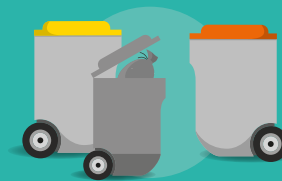
Bac de 45 à 240 L en dotation familiale

(pour les emballages et papiers dans certains centres-villes). Ils seront remplacés à terme par des bacs et Points d'Apport Volontaire jaunes