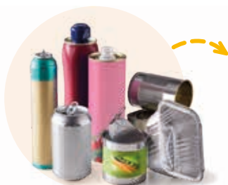
Emballages en métal (boîtes de conserve, canettes, aérosols...)

► DÉPOSEZ VOS EMBALLAGES ET PAPIERS EN VRAC DANS LE SAC JAUNE, LE BAC JAUNE OU LES POINTS D'APPORT VOLONTAIRE