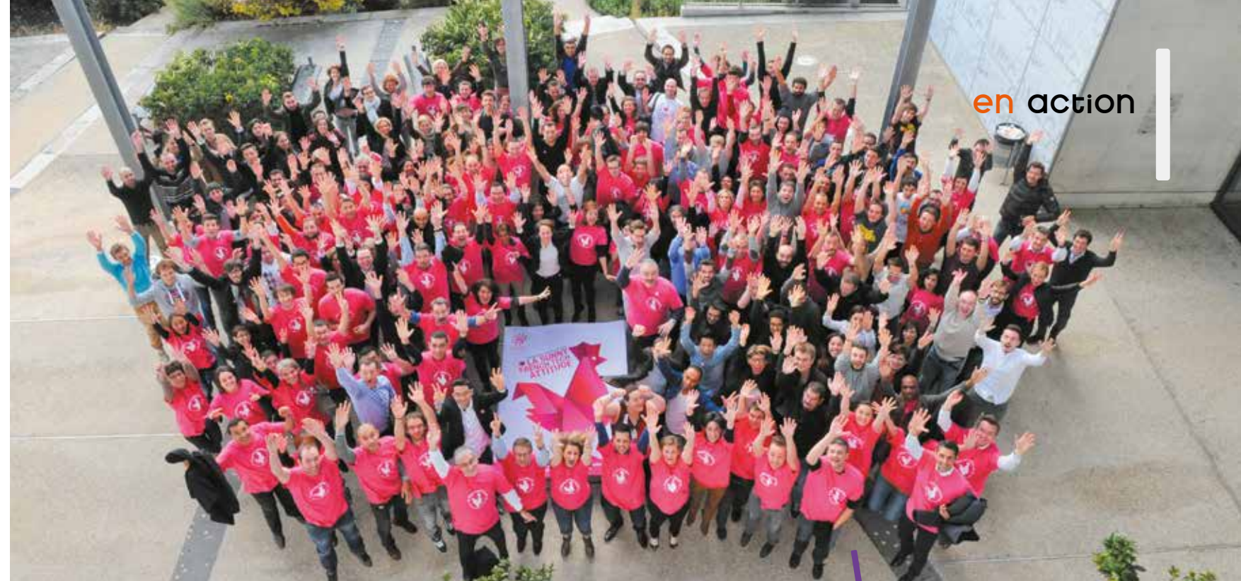
Après une grande mobilisation l'an dernier pour le label French Tech, la filière du numérique s'est dotée d'un plan d'actions pour 2015.