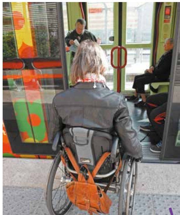
Le réseau de tramway de Montpellier Méditerranée Métropole est 100% accessible.

Dix ans après la loi du 11 février 2005, 100% des tramways et bus de la Métropole sont accessibles. Un travail partenarial efficace mené avec les associations de personnes handicapées. La collectivité poursuit son engagement en aménageant au fur et à mesure les arrêts de bus sur tout le territoire.