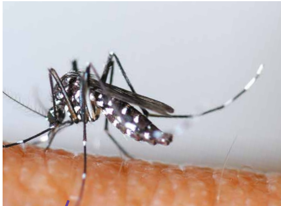
Malgré ses rayures noires et blanches, le moustique tigre, en raison de sa très petite taille, n'est pas facile à identifier.

Depuis quelques années, le moustique tigre a élu domicile sur le territoire de la Métropole et sa population continue de croître aux côtés de ses autres congénères, cependant moins redoutables. Le « tigre » est un insecte nuisible, transmetteur potentiel de maladies, colonisant les zones habitées et contre lequel il n'existe pas de remède miracle, hormis une mobilisation humaine pour limiter sa prolifération. À partir d'avril, il reprend du service, une piqûre de rappel s'impose !