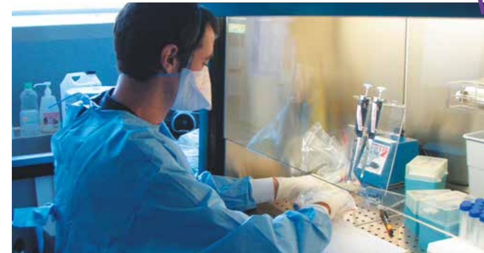
Des scientifiques de l'IRD travaillent sur le moustique-tigre.

autres insectes environnants, comme les papillons ou les abeilles », précise Frédéric Simard. Le projet le plus abouti actuellement est la production en masse de mâles stérilisés pour venir perturber la reproduction de l'espèce. Cette technique sera prochainement testée à la Réunion, une région particulièrement touchée par le moustique tigre.