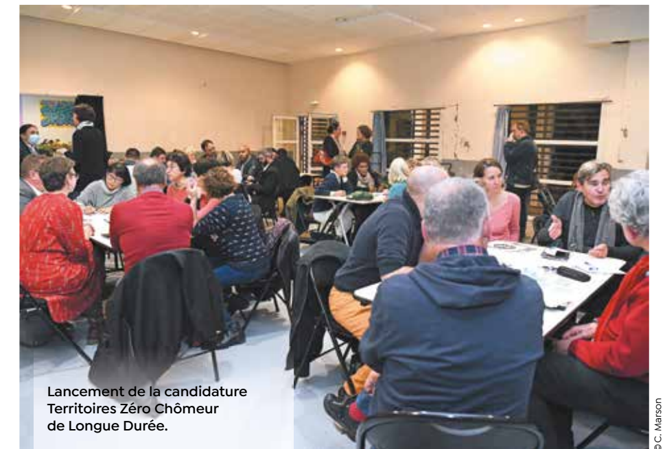
Lancement de la candidature Territoires Zéro Chômeur de Longue Durée.

Si vous habitez les quartiers de La Valsière à Grabels ou Les Hauts de Massane à Montpellier et que vous souhaitez participer à la construction de la démarche Territoires Zéro Chômeur Longue Durée, renseignez-vous auprès de : tzclid@montpellier3m.fr