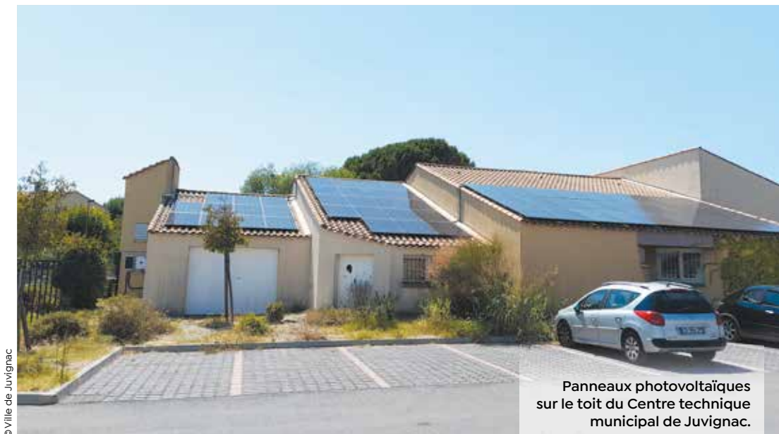
Panneaux photovoltaïques sur le toit du Centre technique municipal de Juvignac.

« J'invite les communes à exploiter leur potentiel photovoltaïque et à s'engager dans les projets de production d'énergie solaire en mettant des toits à disposition. J'invite les citoyens désireux de participer à la transition énergétique à nous rejoindre en devenant bénévoles ou en investissant financièrement dans la société à des conditions avantageuses. »