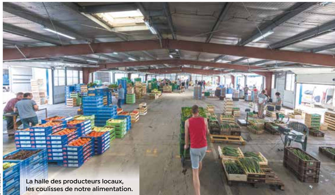
La halle des producteurs locaux, les coulisses de notre alimentation.

Également dénommé Marché d'intérêt national (MIN) le marché-gare est la plateforme logistique alimentaire de Montpellier. Installé dans le quartier Prés d'Arènes, il fête six décennies d'activités, en impulsant de nouveaux projets pour faciliter l'accès du plus grand nombre à une alimentation de qualité.