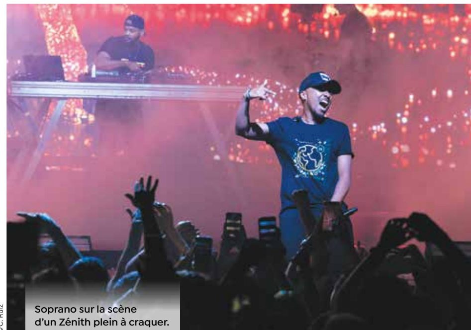
Soprano sur la scène d'un Zénith plein à craquer.