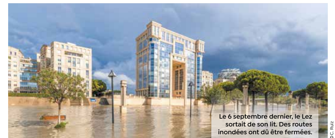
Le 6 septembre dernier, le Lez sortait de son lit. Des routes inondées ont dû être fermées.