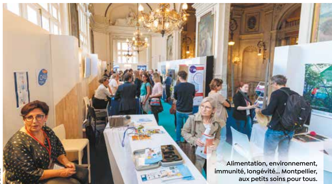
Alimentation, environnement, immunité, longévité... Montpellier, aux petits soins pour tous.

La sixième édition de Futurapolis santé, organisée par le magazine Le Point avec la Ville et la Métropole de Montpellier, s'installe les 7 et 8 octobre à l'opéra Comédie. Rencontres, débats, conférences sur le thème : Ma santé, ma bataille . Entrée gratuite.