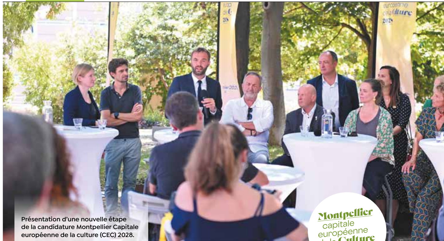
Présentation d'une nouvelle étape de la candidature Montpellier Capitale européenne de la culture (CEC) 2028.

Montpellier capitale européenne de la Culture 2028