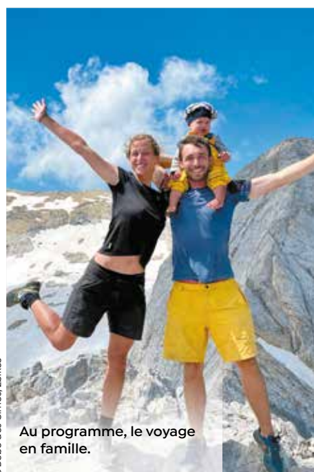
Au programme, le voyage en famille.