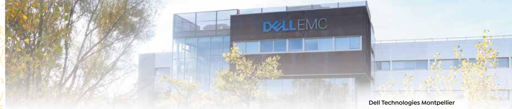
Dell Technologies Montpellier

Réponses : 1 La salle de cinéma expérimental de Clapiers utilisait le Panrama, un procédé optique qui place le spectateur à l'intérieur d'une coupole hémisphérique inclinée. Elle est actuellement désaffectée. 2 Muro Vetulo (muraille vieillie en latin), fait référence aux fortifications de l'oppidum gallo-romain d'Altimurum, seuls vestiges conservés après l'abandon du site au VIII e siècle après J.-C. 3 La glacière de Castelnau-le-Lez (avenue Roger-Salengro) stockait la glace qui avait été transportée l'hiver dans des sacs de toile, de nuit, à dos de mulet, puis transférée sur des charrettes jusqu'à la palme. 4 Le Collège des Écossais (533, avenue Abbé-Paul-Parquet à Montpellier) a été fondé en 1924 comme lieu d'étude par le botaniste et urbaniste Patrick Geddes et réalisé par l'architecte Edmond Leenhardt. 5 Long de 14 kilomètres, l'aqueduc Saint-Clément captait les eaux de Saint-Clément-de-Rivière et les acheminait jusqu'au château d'eau de la promenade du Peyrou, à Montpellier. Datant du XVIII e siècle, il est l'œuvre de l'ingénieur Henri Pitot.