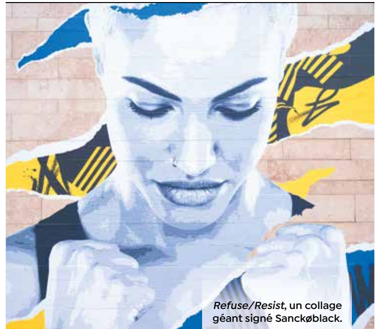
Refuse/Resist, un collage géant signé Sanckøblack.