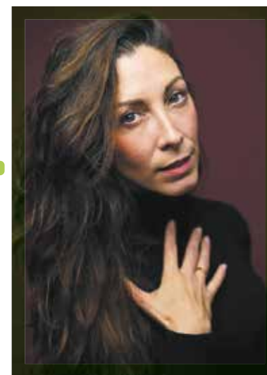
Chorégraphe de la cérémonie d'ouverture

“ Un renouveau pour les sports de glace ”