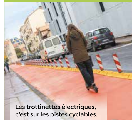
Les trottinettes électriques, c'est sur les pistes cyclables.

C'est déjà le cas selon la loi, sauf autorisation spéciale de la mairie. Ce qui n'est pas le cas à Montpellier où les utilisateurs de trottinettes électriques n'ont pas le droit de circuler sur les trottoirs piétons. Seuls les utilisateurs de rollers, skateboard ou trottinette sans moteur sont considérés comme des piétons et doivent rouler sur le trottoir. Les trottinettes électriques, ou encore hoverboard, gyropode, monoroue, sont considérés comme des cyclistes. Ils doivent circuler sur la piste cyclable ou la chaussée.