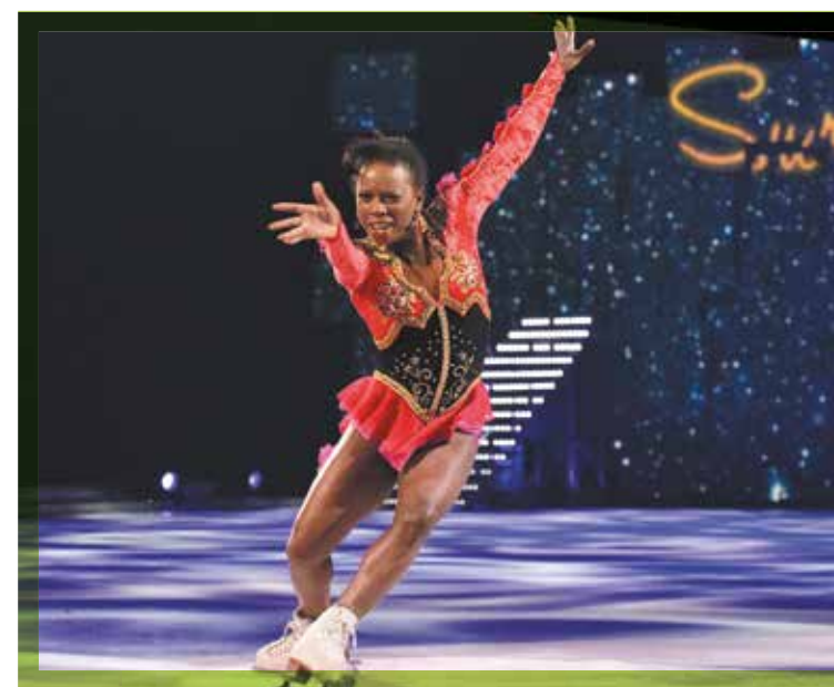
Marraine des championnats du monde