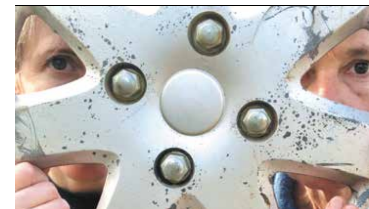
© Evelina Cordero - Kim Jonker