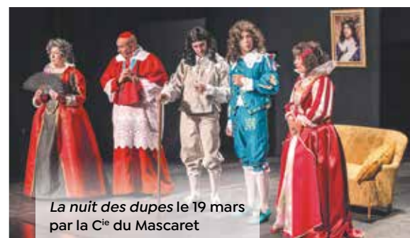
La nuit des dupes le 19 mars par la C ie du Mascaret