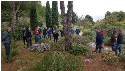
Formation des agents

Ces investissements bénéficient d'une aide Feder à hauteur de 60%.