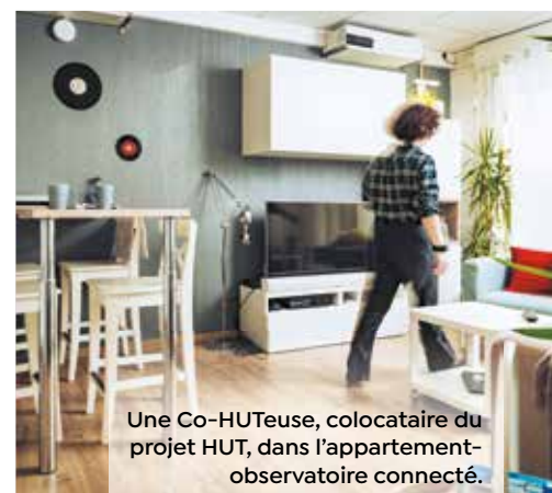
Une Co-HUTEuse, colocataire du projet HUT, dans l'appartement-observatoire connecté.

En 2023, l'expérience HUT se poursuit, avec un