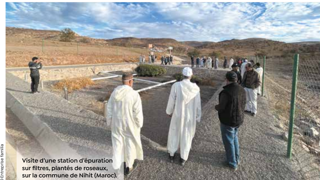
Visite d'une station d'épuration sur filtres, plantés de roseaux, sur la commune de Nihit (Maroc).

EUROS ont été alloués par an pour des projets eau et agroécologie au Maroc et au Sénégal directement pilotés par la Métropole ; 50 000 euros par an à des ONG pour financer des projets solidaires (Afrique, Inde, Liban) par le biais du Fonds Eau.