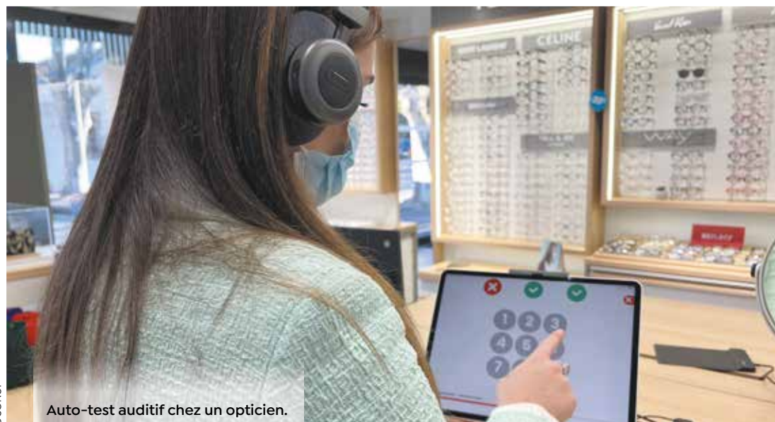
Auto-test auditif chez un opticien.

Le 9 mars, c'est SONUP qui équipera les bornes de dépistage auditif utilisées lors de la Journée nationale de l'audition. Une application parmi d'autres de la solution créée par cette start-up montpelliéraine qui ne cesse de grandir à Cap Omega.