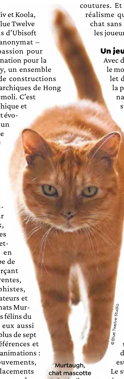
Murtaugh, chat mascotte du studio.

Aujourd'hui, l'équipe est déjà dans les start-up-blocks, imaginant une suite – ou non – à l'aventure de ce premier jeu ..., et qu'il est encore trop tôt d'évoquer. Le studio a été nommé dans six catégories. « C'est un honneur et